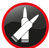
Cartouches pour armes de chasse ou de sport (5 kg de poids brut emballé max par passager) Ammunition for hunting or sport rifles (5kg including container per passenger)