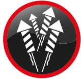
Feux d'artifice Fireworks