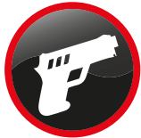
Armes à feu et objets y ressemblant ou objets assimilés Firearms and similar objects