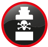
Poisons et substances infectieuses Poisons and infectious substances