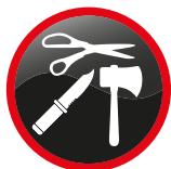
Armes blanches (couteaux, ciseaux...) Bladed weapons (knives, scissors...)