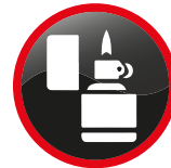
Briquets de type Zippo et allumettes en pochette Zippo lighters and safety matches