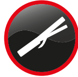
Fer à friser contenant des gaz d'hydrocarbure Curling iron containing hydrocarbon gas