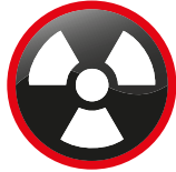
Matières radioactives Radioactive materials