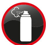
Aérosols Aerosol products