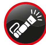
Lampes de plongée (batterie ou ampoule enlevée et protégée) Diving lights (battery or bulb removed)