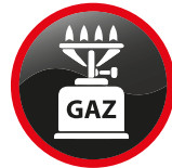
Cartouche pour réchaud de camping Cartridge for camp stove