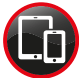
Appareils électroniques portables (AEP) avec batteries ≤ 100 Wh. Batteries retirées et mises en cabine si transport en soute Portable Electronic Devices (PED) with batteries ≤100 Wh with battery removed and put in cabin if device in the checked baggage