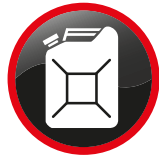
Liquides inflammables Flammable liquid