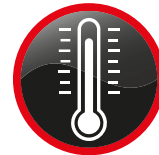
Thermomètre à mercure Mercury Thermometer