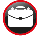
Mallettes et serviettes équipées d'alarme Briefcases equipped with alarm