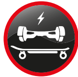
Hoverboard - Skateboard, Vélo et trottinette électrique Hoverboard - Electric skateboard, bike & scooter