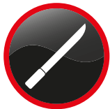
Objets contondants (casse-têtes, batte, sabre...) Blunt objects (club, bat, machete...)