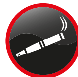
Cigarettes électroniques (batterie enlevée et protégée) Electronic cigarettes (battery removed and protected)