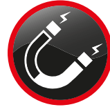
Masses magnétiques Magnetic masses