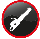
Tronçonneuse Chain saw