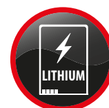
Batteries au lithium (protégées des courts-circuits) ≤ 100 Wh : 20 batteries de rechanges max par passager. entre 100 Wh et 160 Wh : 2 batteries de rechanges max par passager. Lithium batteries (protected from short circuits) ≤ 100 Wh: 20 spare batteries max per passenger. between 100 Wh and 160 Wh: 2 spare batteries max per passenger.